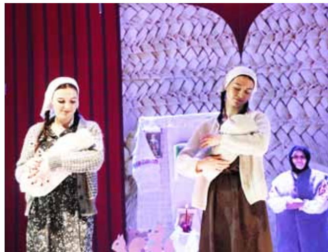
Народны тэатр эстрадных мініяцюр «Штрых» раённага Дома культуры ДУК «Цэнтралізаваная клубная сістэма Шклоўскага раёна»

У намінацыі «Лепшая мужчынская роля» быў вызначаны Яўген Аношка, творчая група ДУК «Цэнтралізаваная клубная сістэма Слаўгарадскага раёна» за спектакль па п'есе Э.Піжэнка