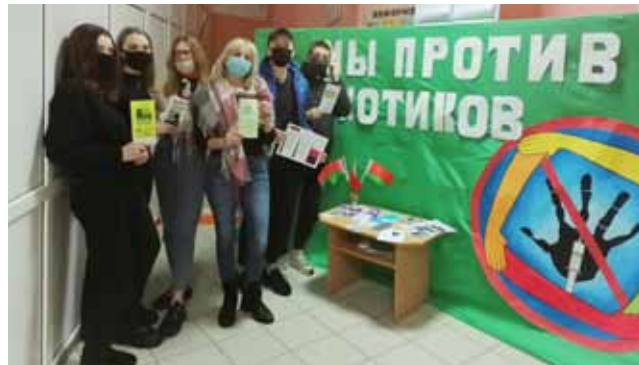
Районный конкурс творческих работ, Краснопольский район

Активное участие в профилактической акции «Вместе против наркотиков» приняли свыше 340 клубных учреждений Могилевской области. На информационных стендах учреждений размещалась информация по пропаганде здорового образа