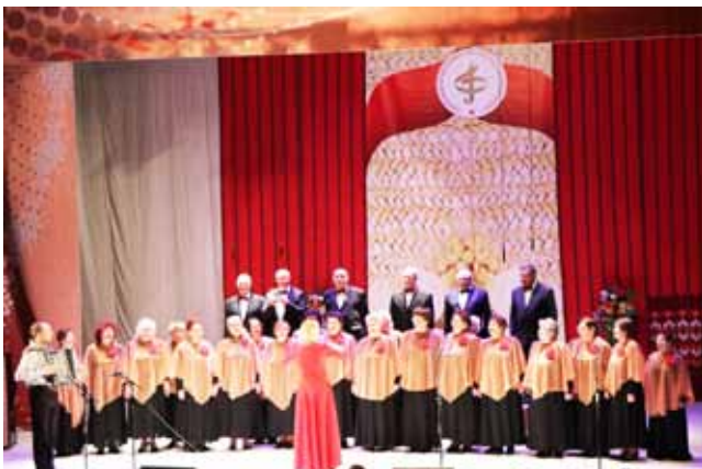
Абласны агляд-конкурс калектываў мастацкай творчасці і індыўдуальных выканаўцаў XV рэспубліканскага фестывалю народнай творчасці ветэранскіх калектываў «Не старэюць душой ветэраны»

У рамках рэспубліканскага свята «Купалле» («Александрыя збірае сяброў») была арганізавана работа выставы-кірмашу «Александрыйскі кірмаш», тэматыкай якой стала «Свята нацыянальнага касцюма». На 4-х паралельных радах працавалі розныя экспазіцыйна-