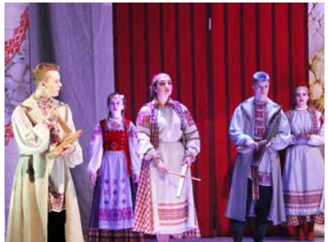
Тэатр чытальнікаў «Вытокі» ДУА Магілёўскі дзяржаўны каледж мастацтваў», г. Магілёў літаратурна-тэатралізаваная кампазіцыя па аповесці М.Гарэцкага «Цёмны лес»

у спалучэнні з яркай харэаграфіяй, пластычнай выразнасцю ўздзейнічала на гледача і пакінула моцнае незабыўнае ўражанне. Літаратурна-пластычная кампазіцыя, у выкананні навучэнцаў тэатральнага аддзялення стала пранікнёным творчым заклікам да кахання, міру і стварэння.