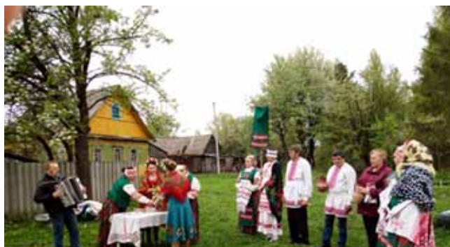
Обрядовый праздник «Свята Юр'я»

Одной из долгосрочных целей в работе учреждений централизованной клубной системы Костюковичского района разработка нового механизма повышения конкурентоспособности клубных учреждений района, задействование исторического и культурного потенциала для создания новых культурных событий в каждом населенном пункте, а также создание системы передачи знаний о локальных народных традициях.