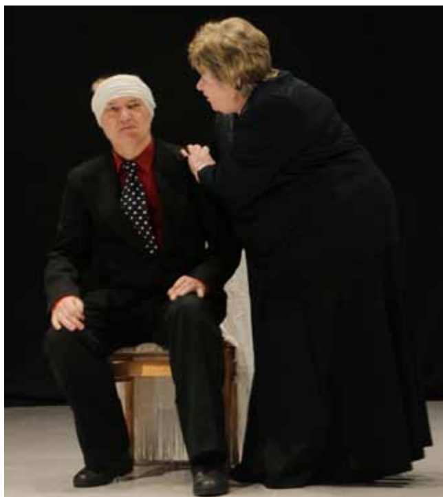
Народны тэатр «Шалом» ГА «Магілёўская яўрэйская грамада»

«За паўгадзіны да вясны», рэжысёр Н.Купрэнка. П'еса была перакладзена на беларускую мову, у якой падымалася тэма вайны. Дзеянне разгортваецца ў вайсковым лазарэце. За добра згуляную ролю параненага салдата Івана, акцёр атрымаў заслужаную ўзнагароду.