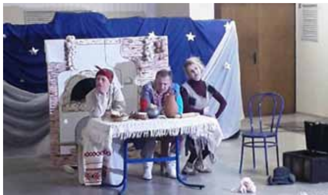
Фрагмент спектакля «Прыгоды Бадзюлі», литературный клуб «Окрыление», Костюковичский район