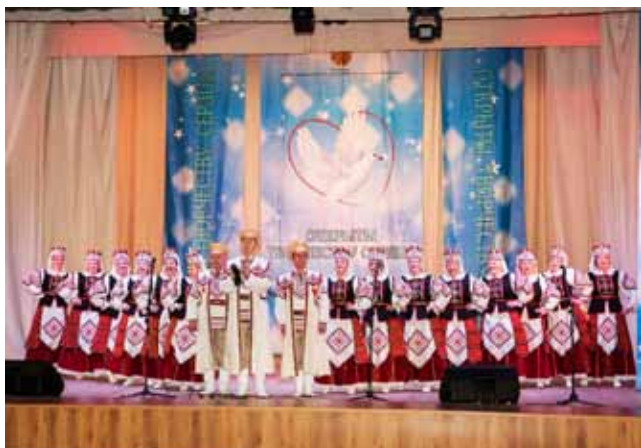
VII Міжнародны фестываль-конкурс выканальніцкага майстэрства «Открыты творчеству сердца», Брянск, РФ, 2019