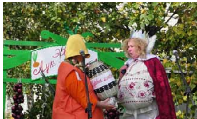
Народный праздник «Луков день»