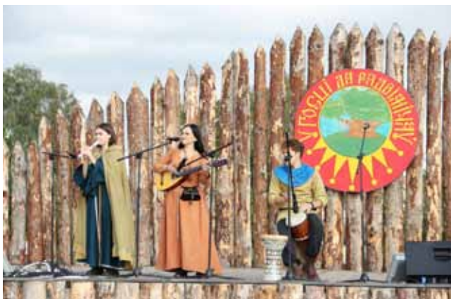
Рэгіянальнае этнасвята «У госці да радзімічаў», Чавускі раён

З мэтай стварэння ўмоў для развіцця народных мастацкіх рамёстваў у Магілёўскай вобласці дзейнічаюць 17 Дамоў (Цэнтраў) рамёстваў і Быхаўскі раённы Цэнтр культуры народнай творчасці і рамёстваў, з якіх 5 знаходзяцца ў сельскай мясцовасці. За 2020 год раённымі Дамамі (Цэнтрамі) рамёстваў праведзена звыш 2600 культурных мерапрыемстваў.