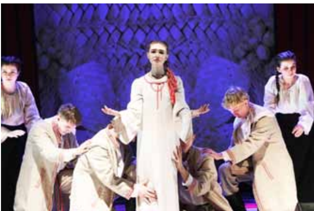
Тэатр чытальнікаў «Вытокі» ДУА Магілёўскі дзяржаўны каледж мастацтваў», г. Магілёў літаратурна-пластычную кампазіцыю па паэме А.Казекі «Марыйка»

Вышэйшую ўзнагароду конкурсу – дыплом Гран-пры атрымаў тэатр чытальнікаў «Вытокі» ДУА Магілёўскі дзяржаўны каледж мастацтваў» г.Магілёва за літаратурна-пластычную кампазіцыю па паэме А.Казекі «Марыйка», рэжысёр А.Ерашук. У аснову твора ляглі ўспаміны маці паэта і рэальныя трагічныя падзеі, што адбыліся падчас Вялікай Айчыннай вайны. Спектакль атрымаўся яркім і насычаным. Праглядаліся цікавыя рэжысёрскія хады. Прафесійна падабрана музычнае і мастацкае афармленне спектакля. Валоданне артыстамі паэтычным словам