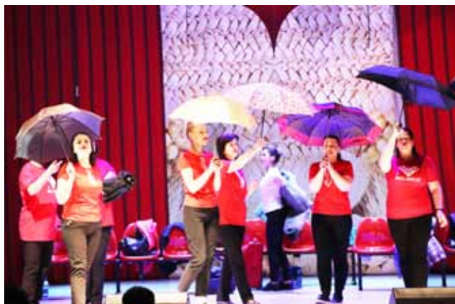
Народны тэатр чытальнікаў «Сюжэт» раённага Цэнтра культуры ДУК «Цэнтралізаваная клубная сістэма Магілёўскага раёна»