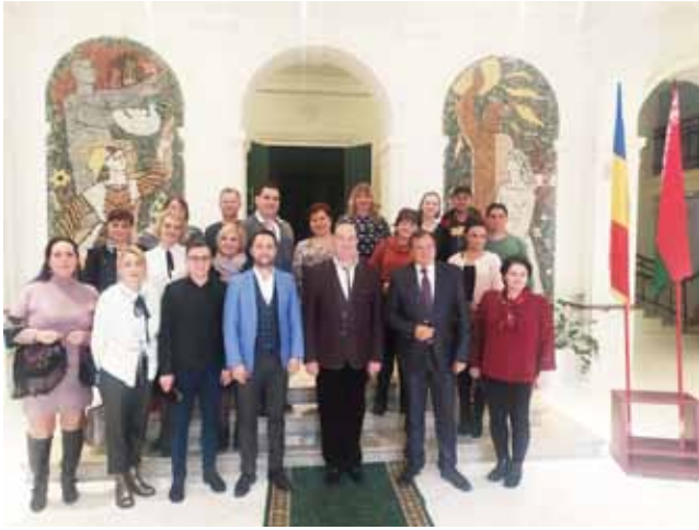
Дэлегацыя Магілёўскай вобласці ў Румыніі

ру была арганізавана паездка дэлегацыі Магілёўскай вобласці ў Румынію, дзе размяшчаецца дзелавы цэнтр Асацыяцыі, з ліку спецыялістаў цэнтра і дырэктароў раённых, гарадскіх клубных устаноў Магілёўскай вобласці для абмену вопытам па арганізацыі работы клубных устаноў.