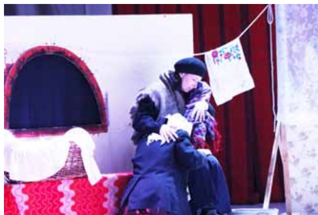
Народны тэатр ДУК «Палац мастацтваў г.Бабруйска»