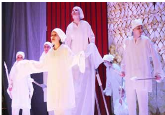
Народны тэатр УК «Палац культуры вобласці» г.Магілёва

Спецыяльнымі дыпламамі былі ўзнагароджаны: у намінацыі «Лепшая рэжысёрская пастаноўка» – народны тэатр ДУК «Палац мастацтваў г.Бабруйска» за спектакль «Бор-