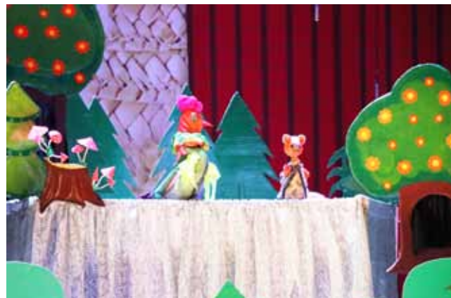
Узорны тэатр лялек «Паўлінка» Редкарожскага сельскага Дома культуры ДУК «Цэнтралізаваная клубная сістэма Бабруйскага раёна»