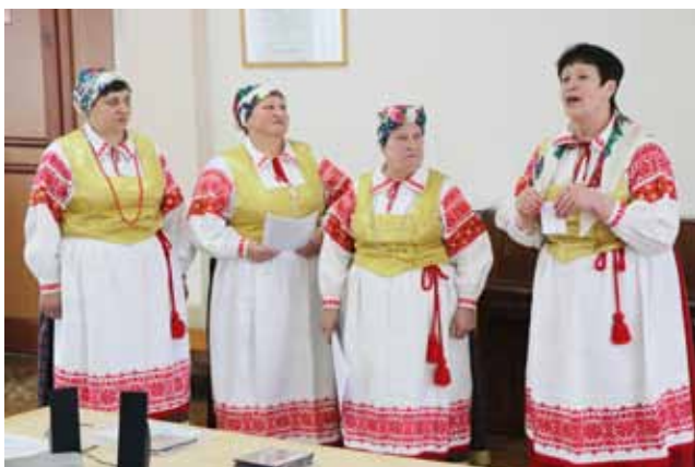
Владыка Л.В. (руководитель), народный аутентичный фольклорный ансамбль «Паршынскія зоры» ГУК «Централизованная клубная система Горецкого района»

ского сельского Дома культуры ГУК «Централизованная клубная система Бобруйского района» провела мастер-класс на тему «Сохранение песенного наследия из опыта работы народного фольклорного ансамбля «Дубрава». Коллектив был создан в 1964 году и как сказала руководитель коллектива: «Удзельнікі нашага калектыву за гады яго існавання захавалі і перадалі малодшаму пакаленню шмат нашай спадчыны, калектыў можна сказаць без перапынку, увесь час падаўжае і падаўжае яе бытаванне. Свае песні мы бяром ад матуль, бабуль і старэйшых жыхарак вёсак, да якіх мы ходзім з экспедыцыямі».