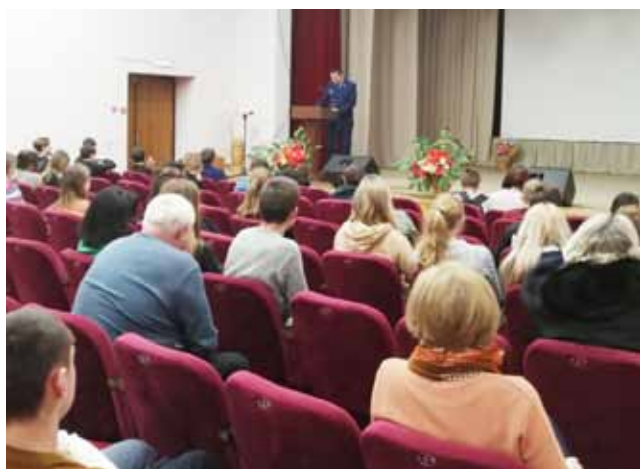
Расширенное заседание комиссии по делам несовершеннолетних, Кличевский район

Специалистами клубных учреждений проводились конкурсы, выставки рисунков, плакатов, буклетов, тематической литературы и методических материалов: выставка буклетов учащихся школ Краснопольского района за 2014 – 2021,