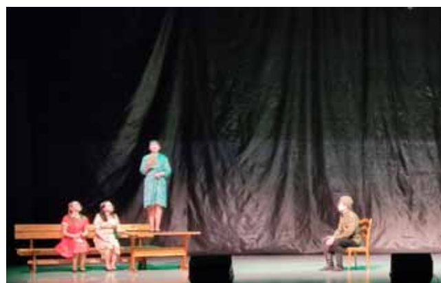
Творчая група аўтаклуба ДУК «Цэнтралізаваная клубная сістэма Кіраўскага раёна»