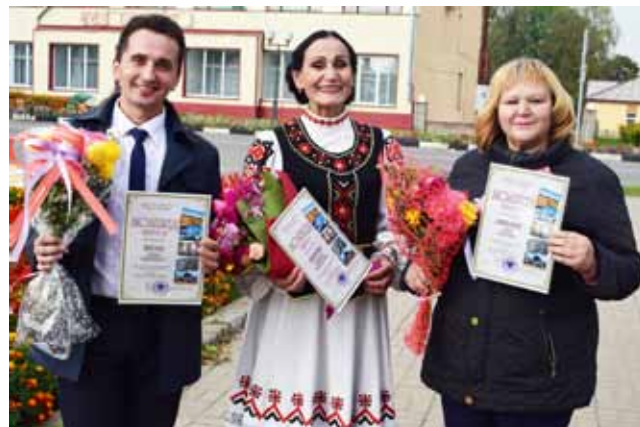
III раённы конкурс літаратурнай творчасці «Краснапольшчына ў сэрцы маім», Краснапольскі раён

Упершыню ў снежны мінулага года была праведзена навагодняя выстава-кірмаш «Новы год ідзе па вялікай планеце», у якой прынялі ўдзел спецыялісты Дамоў (Цэнтраў) рамёстваў, майстры дэкаратыўна-прыкладной творчасці вобласці з 16 раёнаў вобласці і г.Магілёва.