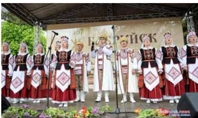
Канцэрт у рамках Міжнароднага фестывалю народнай творчасці «Венок дружбы»