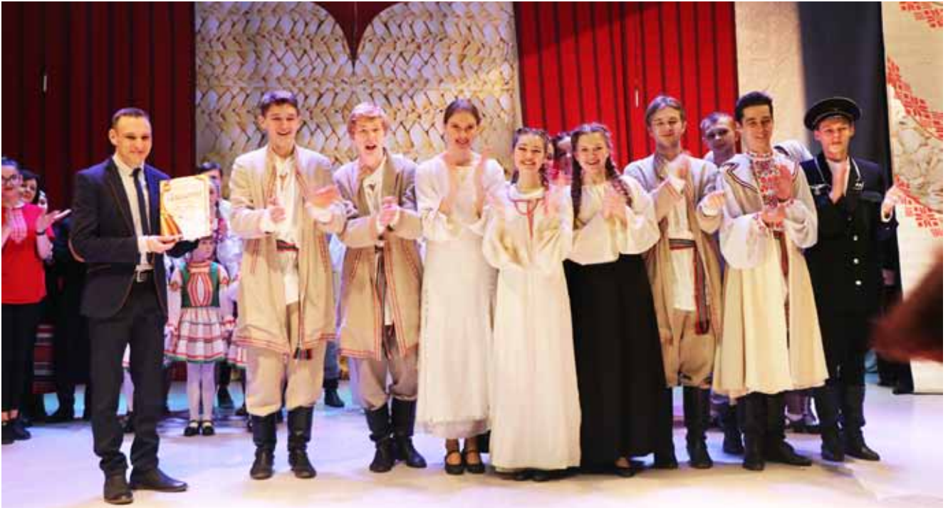
Пераможцы абласнога агляду-конкурсу аматарскіх тэатральных калектываў «У далонях маёй Беларусі»

Абласны агляд-конкурс аматарскіх тэатральных калектываў «У далонях маёй Беларусі» праходзіць з 2011 года адзін раз у два гады. Арганізатарам агляду-конкурсу з'яўляецца ўстанова культуры «Магілёўскі абласны метадычны цэнтр народнай творчасці і культурна-асветнай работы». Асноўныя мэты, якія ставяць арганізатары – гэта захаванне тэатральных традыцый Магілёўскай вобласці, падтрымка і развіццё тэатральнага мастацтва ва ўсіх яго разнавіднасцях, а таксама выяўленне новых творчых тэатральных калектываў і выканаўцаў.