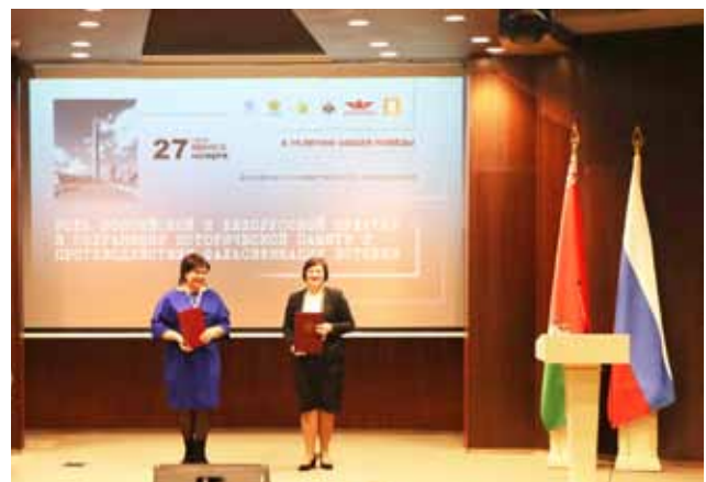
Момант падпісання пагаднення аб культурным супрацоўніцтве паміж УК «Магілёўскі абласны метадычны цэнтр народнай творчасці і культурна-асветнай работы» і ДАУК «Бранскі абласны метадычны цэнтр «Народная творчасць»

У рамках дамоўленасці з Міжнароднай Асацыяцыяй фалькलो-