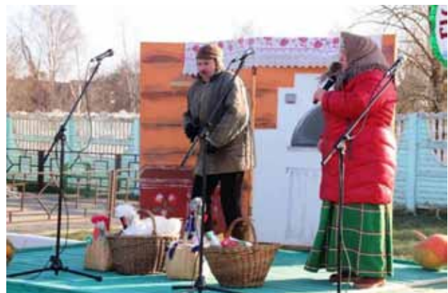
Ярмарка-обряд «Гусінае свята»