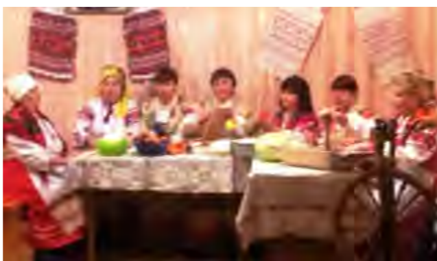
Обрядовый праздник “Капустные вечерки”