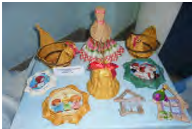
Аматарскае аб’яднанне “Фантазія” Ленінскага СДК

Адной з форм такой работы стала правядзенне ў пачатку года конкурсу і выставы ДПМ і рамёстваў “Жывое дрэва рамяства” аматараў гэтай творчасці. У 2020 годзе конкурс і выстава праводзяцца ўжо