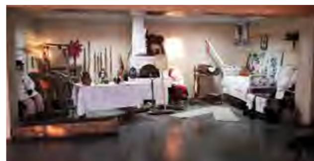
Оформленный тематический уголок “Беларуская хатка”

В 2018 году велась работа по расшифровке песенного фольклорного