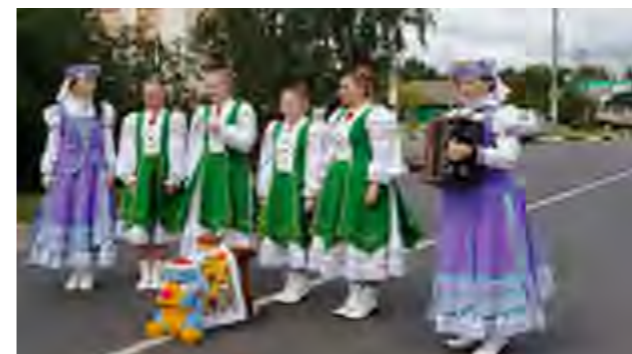
Часть свадебного обряда “Закіданне зайца”

материала, с целью создания сборника песен “Песни моей деревни”. Велась работа по актуализации и восстановлению местных обычаев и обрядов.