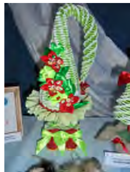
Аддзяленне дзённага наведвання пажылых людзей