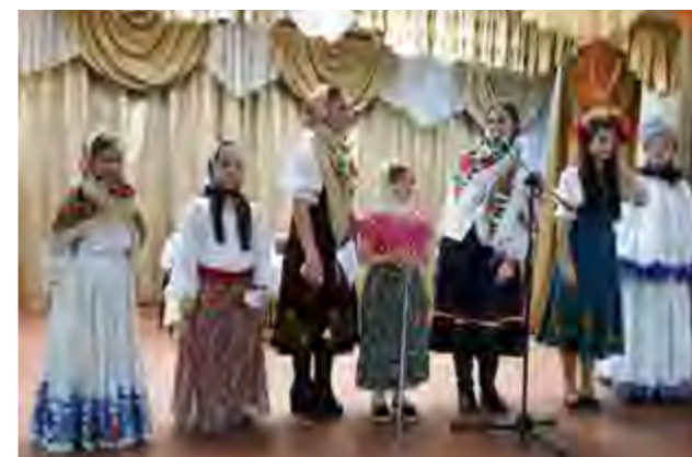
Детские игровые программы подпроекта “Возвращение к истокам”