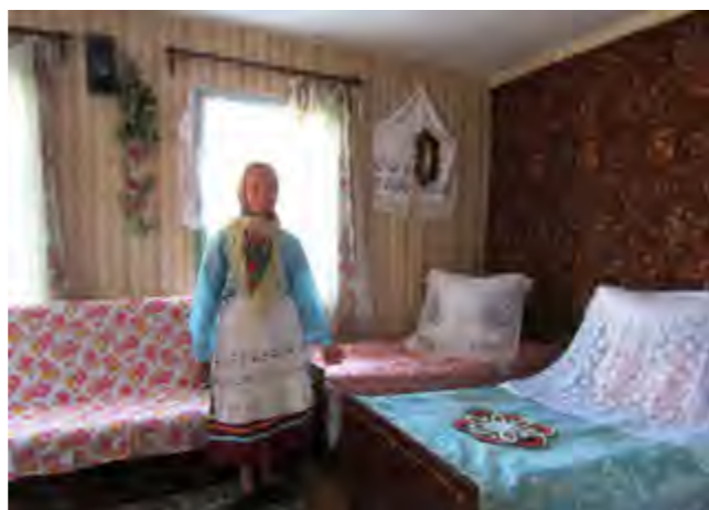
Во время проведения экспедиции

Долгосрочный проект “Традиции Костюковщины – МОЛОДЫМ!” был реализован учреждениями ГУК “Централизованная клубная система Костюковичского района” и был направлен на сохранение и возрождение традиционной культуры, формирование духовной культуры подрастающего поколения на основе приобщения к культурным традициям и обычаям Костюковичского района.