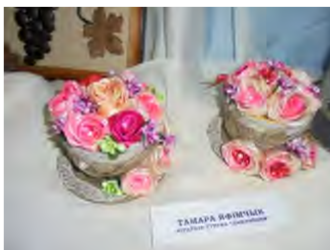
Тамара Яфімчык, кіраўнік гуртка “Дамавенак”