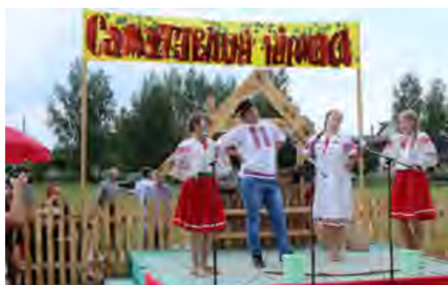
Праздник “Глыньскі кірмаш”