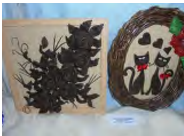
Віта Лесюкова, кіраўнік гуртка “Крэатыўнае рукадзелле”

На якасным узроўні зроблены сувеніры Т.В.Яфімчык, кіраўніка клубнага фарміравання Тур’яўскага СДК, з выкарыстаннем джутавай ніткі, атласных лент.