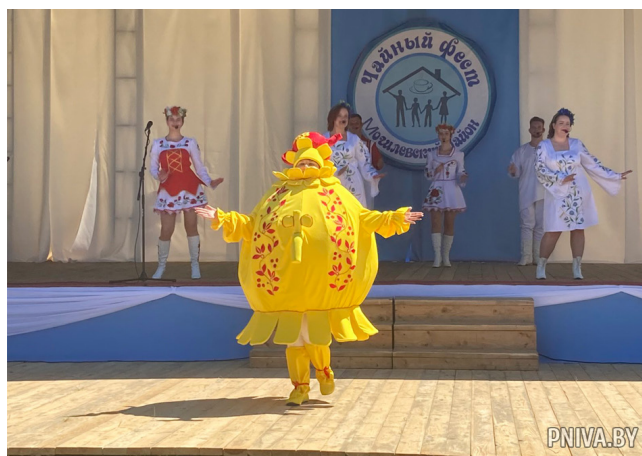
I районный фестиваль семейного отдыха и здорового образа жизни «Чайный фэст», ГУК «Централизованная клубная система Могилевского района»

Шкловского и Чериковского районов, а также приняли участие Могилевское городское отделение общественного объединения «Русское общество» и культурно-просветительное объединение украинцев «Дніпро» г.Могилева.