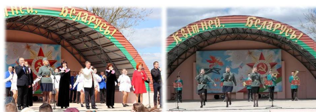
Концертная программа «Звонят салютами Победа!»