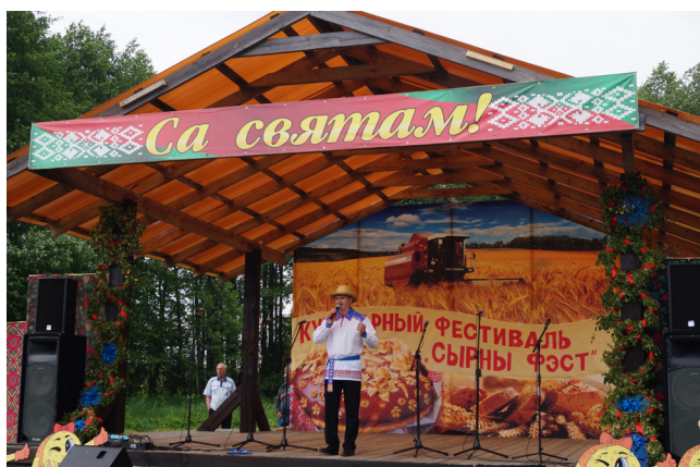
Кулинарный фестиваль «Сырный фэст», ГУК «Централизованная клубная система Славгородского района»

I районный фестиваль семейного отдыха и здорового образа жизни «Чайный фэст» проходил 19 июня 2021 года в агрогородке Восход Могилевского района впервые. На фестиваль приехали творческие делегации Бельничского, Славгородского,