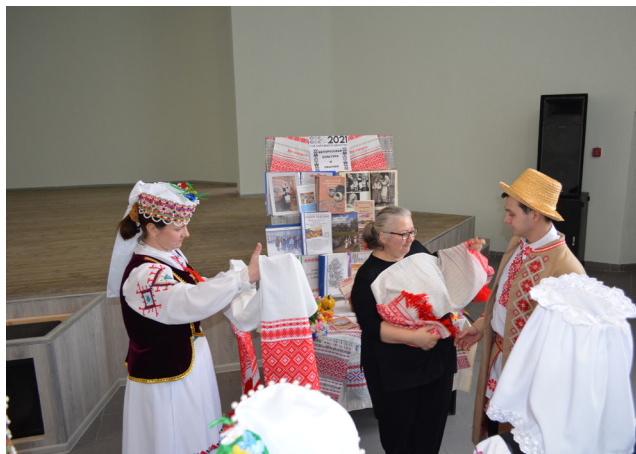
Интерактивная программа «Белорусская культура и обычаи», районный Центр культуры ГУК «Централизованная клубная система Бобруйского района»

Интерактивная программа «Белорусская культура и обычаи» проходила 10 февраля 2021 года в актовом зале районного Центра культуры государственного учреждения культуры «Централизованная клубная система Бобруйского района». Гости и участники программы познакомились с традиционной культурой белорусского народа и Бобруйщины, которая уходит своими корнями в далекое прошлое. Каждый участник интерактивной программы нашел что-то интересное для себя: пели фольклорные песни, танцевали народные бытовые танцы, играли в народные игры, участвовали в обрядовых действиях, вспоминали обычаи своей малой родины.