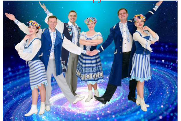
вакальны ансамбль «Млечный путь» Вейнянскага Цэнтра культуры і вольнага часу ДУК «Цэнтралізаваная клубная сістэма Магілёўскага раёна»