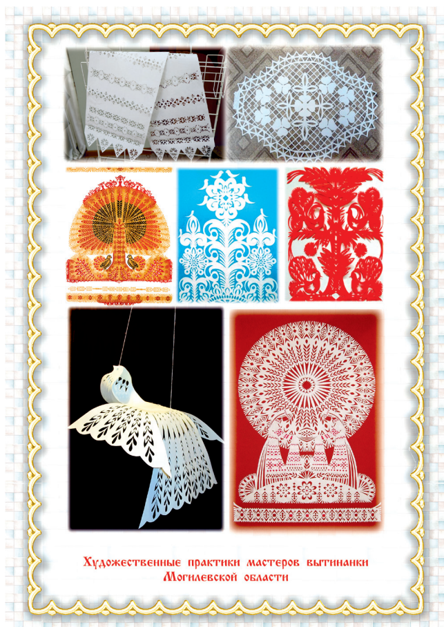
Художественные практики мастеров вытинанки Могилевской области

Постановлением Министерства культуры Республики Беларусь от 30.04.2021 №25 элементу «Беларускае мастацтва выцінанкі» на тэрыторыі Брэсцкай, Віцебскай, Гродзенскай, Гомельскай, Магілёўскай (гг.Бабруйск, Горкі, Крычаў, Магілёў), Мінскай абласцей і г.Мінска» присвоен статус историко-культурной ценности Республики Беларусь.