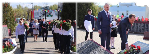
Литературно-музыкальная композиция «Подвигу жить в веках!»

«Война. Кино. Победа!». Для детской аудитории прошел фестиваль красок, концертная программа «Ликуй, победная весна!», спортивный праздник и патриотическая акция «Рекорд Победы!». В вечерней программе для жителей города состоялась концертная программа «Этих дней не смолкнет слава!» победителей районного смотра-конкурса художественного творчества среди организаций и учреждений города «Белый аист-2021».