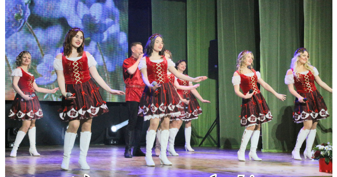
народны вакальны ансамбль «Івіца» УК «Магілёўскі гарадскі Цэнтр культуры і вольнага часу»

званне «Заслужаны аматарскі калектыў Рэспублікі Беларусь»