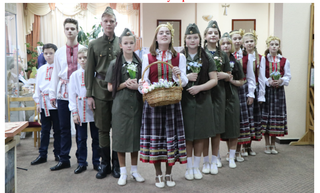
тэатральная студыя «В точку!» ДУА «Магілёўская дзіцячая школа мастацтваў №1»

Віншуем калектывы з дасягнутымі вышынямі, жадаем утрымліваць статус новымі творчымі дасягненнямі, удаस्कанальваць сваё майстэрства, натхнёна працаваць на ніве аматарскай творчасці.